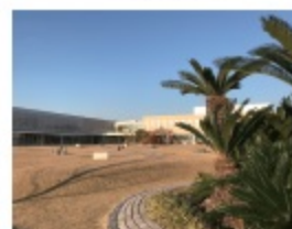
豊橋保健センター『ほいっぶ』