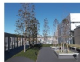
ささしまグローバルゲート